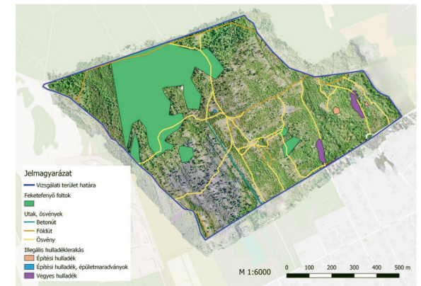
AZ ERDŐ-HÁT-DŰLŐN FELTÁRT KONFLIKTUSOK (saját ábra)