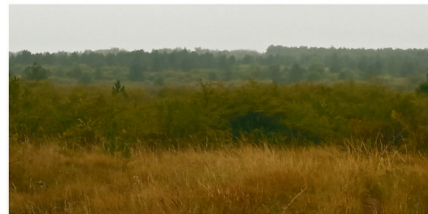
A MINDENHOL MEGJELENŐ FEKETEFEJYŐ